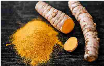
Sgonfia il corpo e aiuta a sciogliere il grasso in eccesso (oggibensere.com)