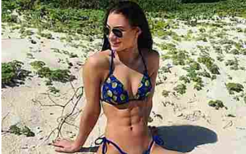
Ecco come eliminare il grasso addominale (oggibensere.com)