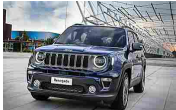
Nuova JEEP® RENEGADE: motore 1.0 Turbo Benzina da 120 CV. Tua a 18.900€ (JEEP®)