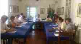
Consiglio comunale di Capri dice no alle slot machine, via le macchinette