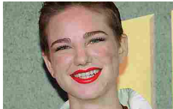
Matrimonio di Fedez e Chiara: ecco gli invitati (ALFEMMINILE)