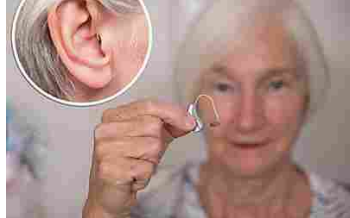
Ecco quanto dovrebbe costare il tuo apparecchio acustico (Hear Clear)