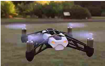
Primo drone professionale a prezzo economico finalmente sul mercato (proreviews.co)