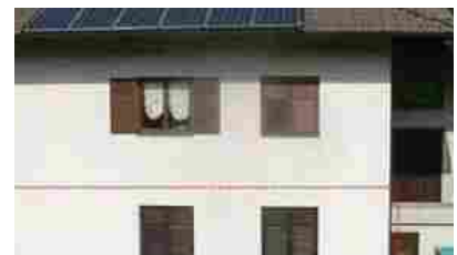
Appartamenti Sarnonico Morenberg