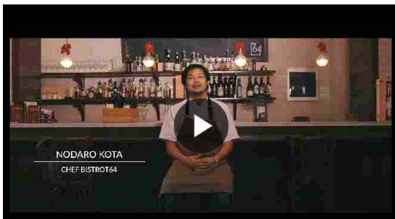
NODARO KOTA CHEF BISTROT64